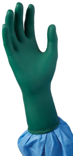
Chirurgische handschoenen: DermAssure™ Geen