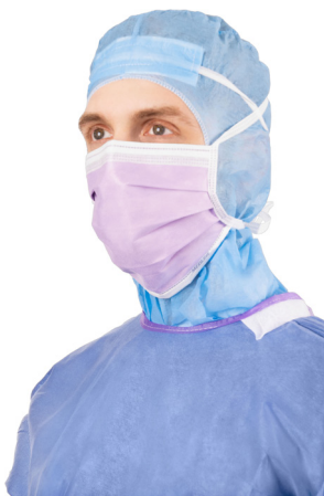
Maskers en astro OK mutsen