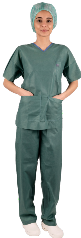
Coperta paziente riutilizzabili

Per informazioni su altri prodotti Medline realizzati in strutture certificate WRAP, contattare: csr-europe@medline.com