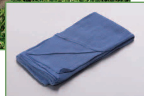
Paño quirúrgico tradicional

En resumen: a mayor absorción, menor número de paños.