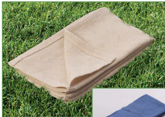
Paño para quirófano Medline® Natural™