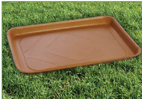
Bandeja de papel reciclable greensmart™