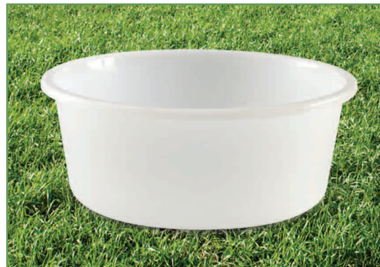
Cubeta de plástico sin pigmentos greensmart™