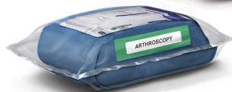
Trousses de procédure stériles