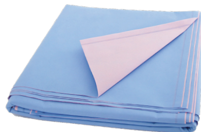
Emballages de stérilisation Gemini