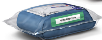
Equipos para procedimientos estériles