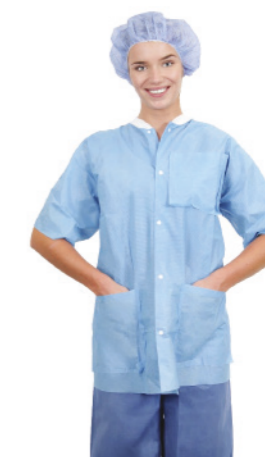
Chaqueta calentadora Essential de manga corta