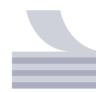
Poca generación de pelusas