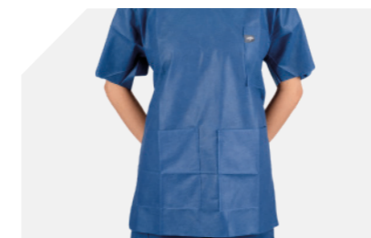
Diseño en forma de campana para un ajuste perfecto

Hemos trabajado con profesionales sanitarios como usted para crear nuestros pijamas quirúrgicos con las características que desea y necesita para rendir al máximo. Prendas limpias y nuevas cada día.