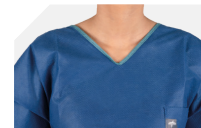
Cuello de pico