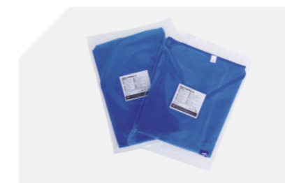
Camisas y pantalones envasados por separado