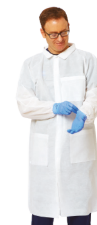
Bata de laboratorio Essential