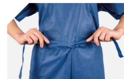
Cintura con cintas ajustables