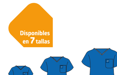
Disponibles en 7 tallas