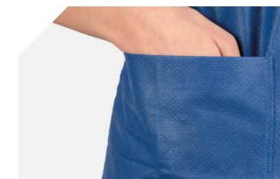
3 prácticos bolsillos en la camisa