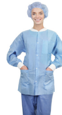
Essential-Thermojacke mit langen Ärmeln