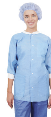
Essential-Thermojacke mit Dreiviertel-Ärmeln