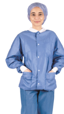
Soft-Thermojacke mit langen Ärmeln

Die Thermojacken von Medline bestehen aus Materialien, die hohen Komfort gewährleisten und angenehm warm halten. Diese haben ein ansprechendes Design und bieten zusätzliche Vorteile, wie einen weichen Strickkragen, elastische Ärmelbündchen sowie drei praktische Taschen.