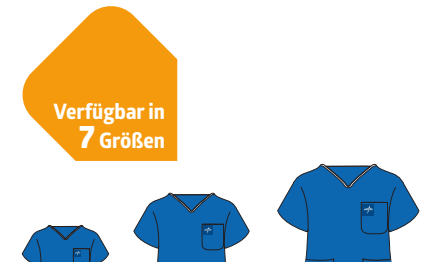
Verfügbar in 7 Größen