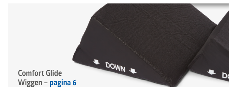
Comfort Glide Wiggen – pagina 6