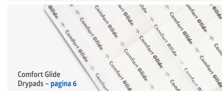
Comfort Glide Drypads – pagina 6