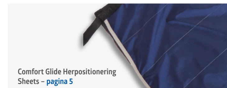
Comfort Glide Herpositioning Sheets – pagina 5