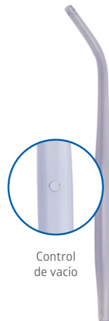
Control de vacío