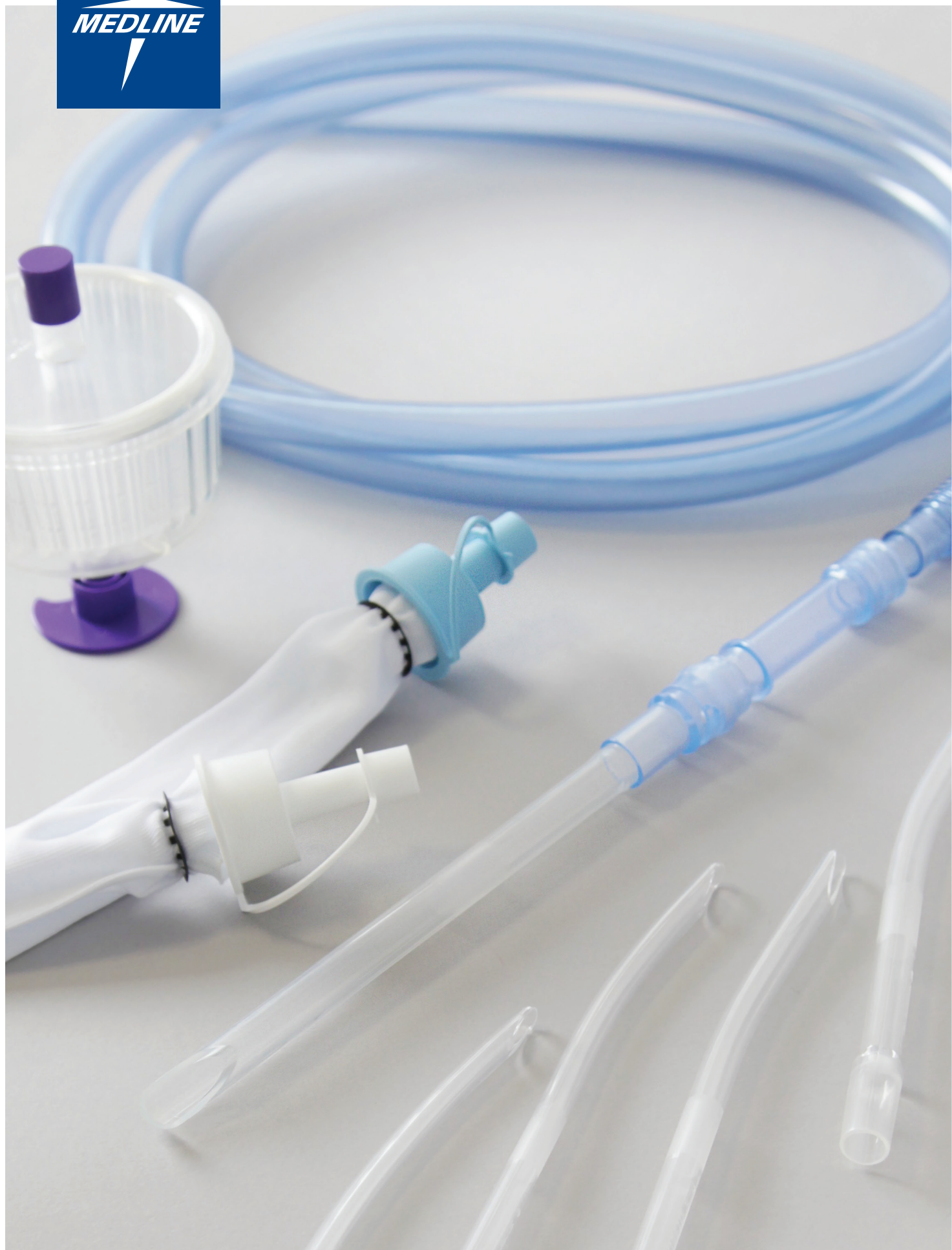
Gamme Aspiration Gynéco-Obstétrique Curette, Tubulure gros diamètre & Dispositif de Prélèvement