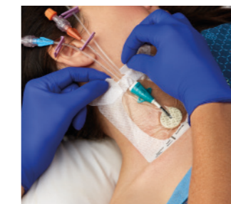
VAD1688-INT 10,2 x 11,4 cm