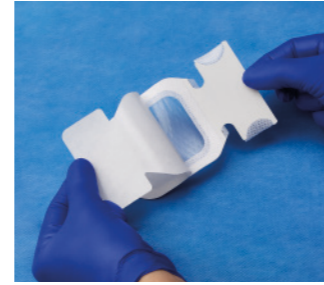
VAD1683-INT 7 x 7,3 cm