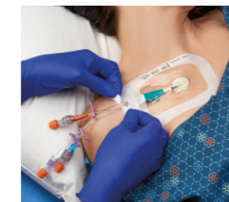
VAD1689-INT 10,2 x 15,5 cm