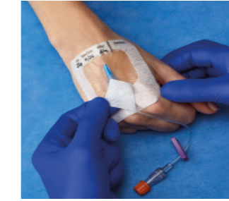
VAD1683-INT 7 x 7,3 cm