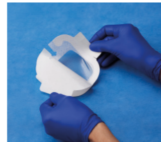
VAD1685-INT 8,9 x 11,4 cm