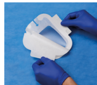
VAD1689-INT 10,2 x 15,5 cm