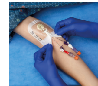
VAD1685-INT 8,9 x 11,4 cm