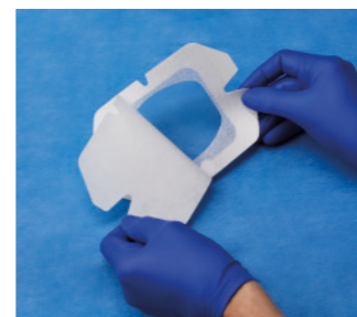
VAD1688-INT 10,2 x 11,4 cm