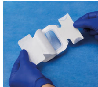
VAD1683-INT 7 x 7,3 cm

Retirar el revestimiento del apósito para dejar expuesto el adhesivo