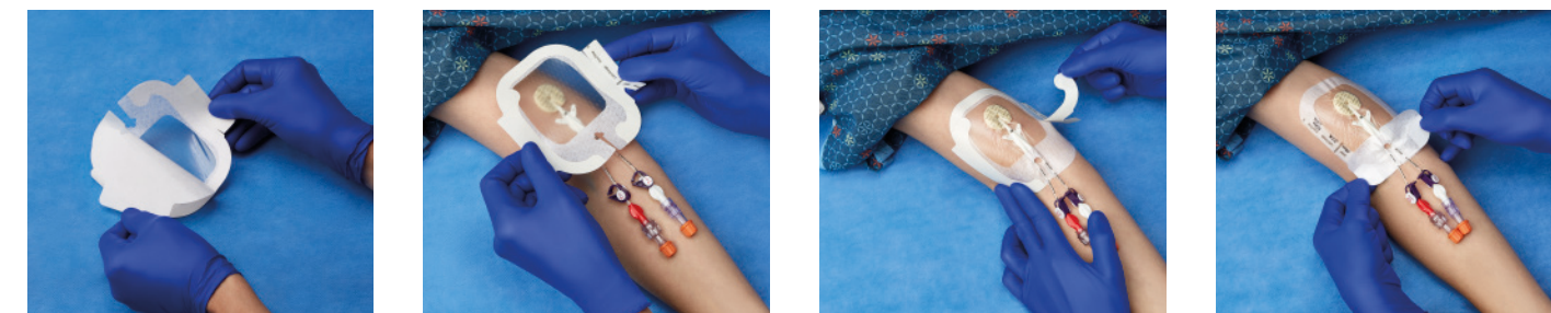
VAD1688-INT 10,2 x 11,4 cm