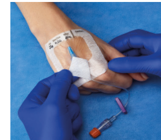
VAD1683-INT 7 x 7,3 cm

Retirar todas las tiras adhesivas de fijación del apósito