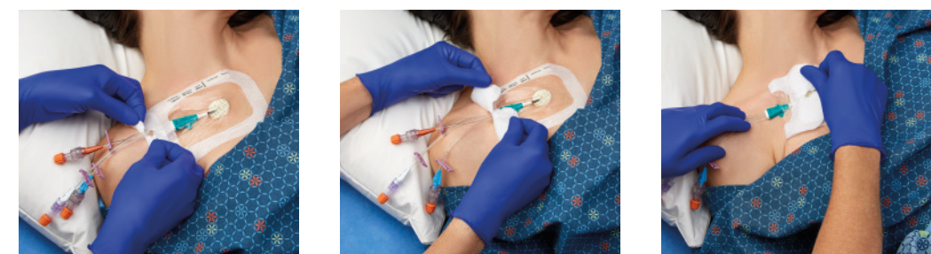
VAD1689-INT 10,2 x 15,5 cm