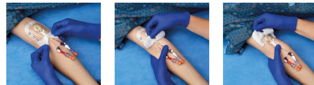
VAD1685-INT 8,9 x 11,4 cm