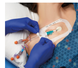
VAD1689-INT 10,2 x 15,5 cm