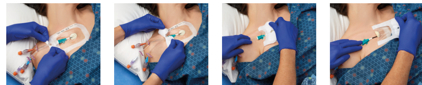
VAD1689-INT 10,2 x 15,5 cm