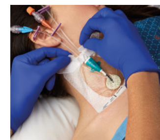
VAD1688-INT 10,2 x 11,4 cm