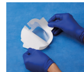
VAD1685-INT 8,9 x 11,4 cm