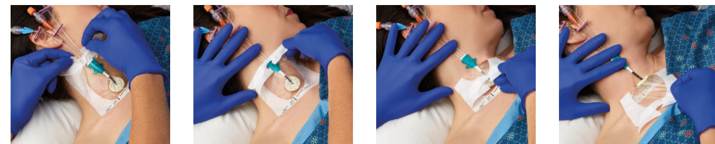
VAD1688-INT 10,2 x 11,4 cm