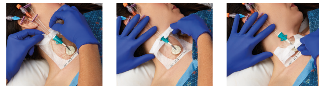
VAD1688-INT 10,2 x 11,4 cm