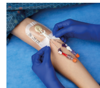
VAD1685-INT 8,9 x 11,4 cm