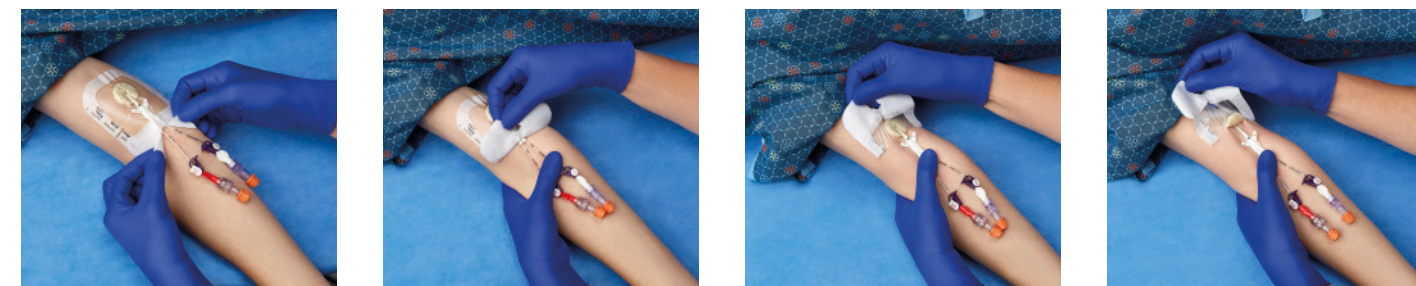
VAD1685-INT 8,9 x 11,4 cm