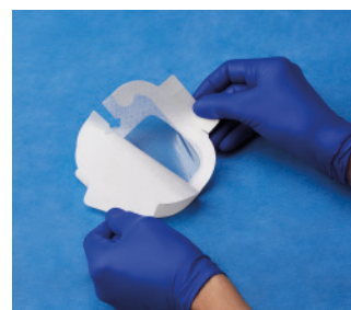
VAD1685-INT 8,9 x 11,4 cm