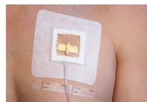
Porta implantada (SV55XT)