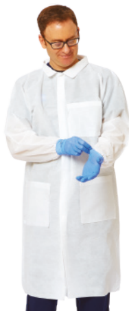
Gama Essential - Bata de Laboratório