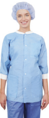
Gama Essential - Casacos Térmicos manga três quartos