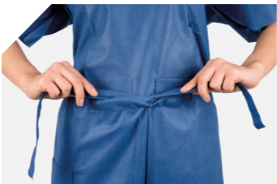
Atilhos à cintura ajustáveis