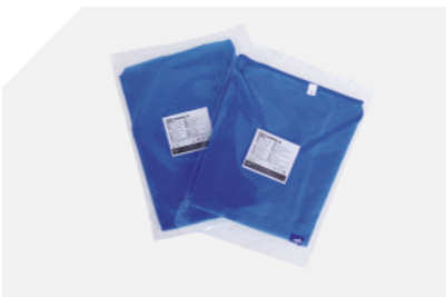
Camisa e calças embaladas à parte