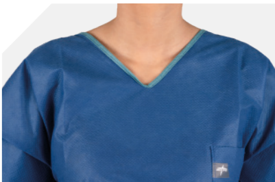
Decote em V