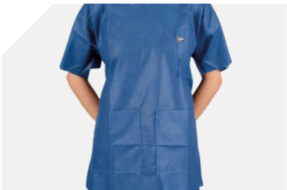
Desenho em forma de sino para um ajuste perfeito

Temos trabalhado com profissionais de saúde, como você, para criar os nossos fatos de bloco com características da sua eleição e com um melhor desempenho. Experimente vestuário novo e limpo todos os dias.