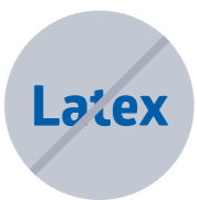
Livre de látex