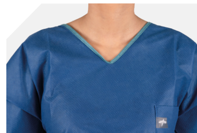
Decote em V