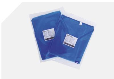
Camisola e calças embaladas à parte