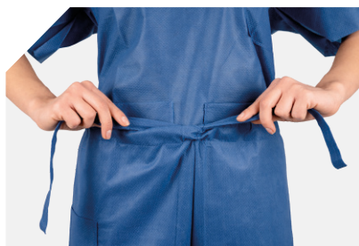
Atilhos ajustáveis na cintura