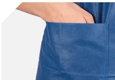
3 handige zakken op het shirt