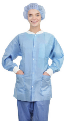
Essential Warm-Up Jacket met lange mouwen assortiment

Medline's disposable Warm-Up Jacket assortiment is ontworpen met materialen die zorgen voor een hoog niveau van comfort terwijl uw personeel warm blijft. Daarnaast hebben ze een intuïtief ontwerp met een zachte tricot kraag, tricot of elastische manchetten en 3 handige zakken.