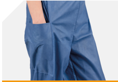
Con singola tasca laterale