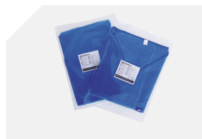
Casacca e pantaloni confezionati separatamente