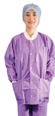
Gamme Soft Violet à manches longues