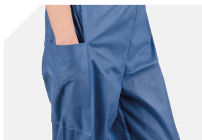
Poche sur un côté du pantalon