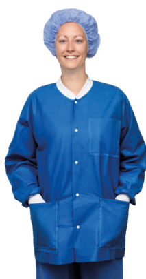
Gamme Ultimate à manches longues