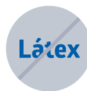
Libre de látex