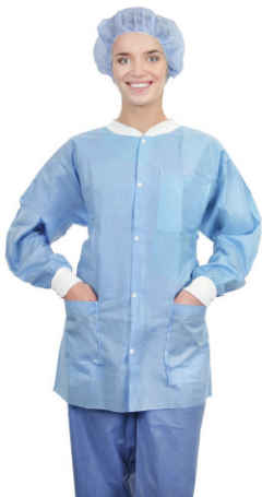
Gama de chaquetas calentadoras Essential de manga larga

Las gamas de chaquetas calentadoras de Medline están diseñadas con materiales que garantizan un alto nivel de comodidad y mantienen a su personal caliente. Además, presentan un diseño intuitivo con un cuello tejido suave, puños tejidos o elásticos y 3 prácticos bolsillos.