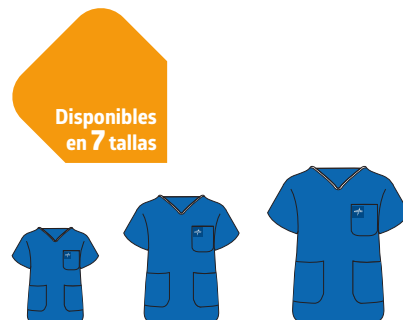
Disponibles en 7 tallas