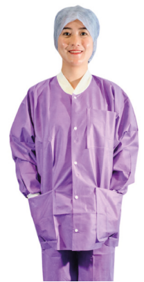
Soft-Thermojacke in lila mit langen Ärmeln