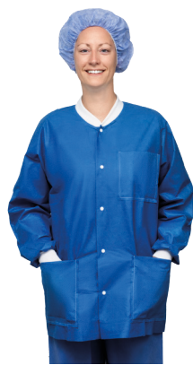
Ultimate-Thermojacke mit langen Ärmeln