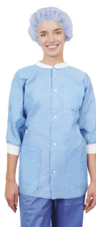
Essential-Thermojacke mit Dreiviertel-Ärmeln