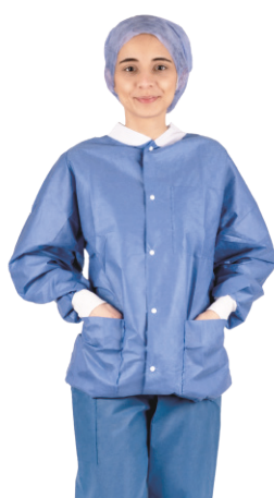
Soft-Thermojacke mit langen Ärmeln