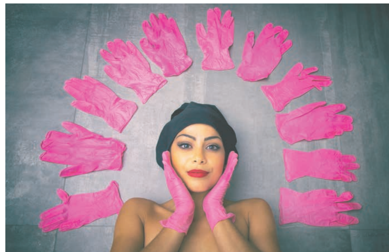
'Esistono mani fatate che possono salvare vite.' „Es gibt magische Hände, die Leben retten können.“ Asur 4 Senigallia, Italien