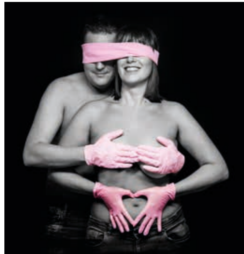
Gewinnerfoto - Pink Glove Fotowettbewerb 2016

„Dieses Foto repräsentiert das Leben und den Drang sich lebendig zu fühlen! Nach gewonnenem Kampf kann ich über meine wunderschönen Körpermakel lachen und freue mich über die wundervollen Möglichkeiten, die das Leben bietet. Ich bin glücklich - Ich habe nur noch eine Brust - Na und? Zärtlichkeiten, ein Kuss oder eine Umarmung sind die beste Medizin. Ich liebe das Leben!“