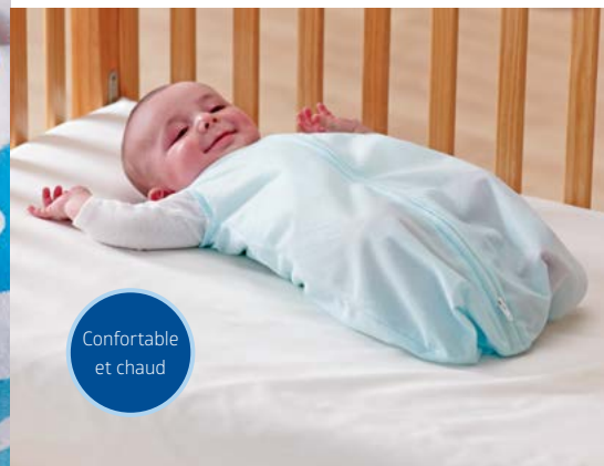
Confortable et chaud