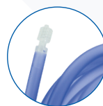
ORISLL con attacco luer-lock