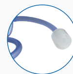
ORISISO Conector ISO 15 macho/22 hembra

Más información. Póngase en contacto con su delegado comercial de Medline o visítenos en: www.medline.eu/es