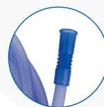
ORISPUSH Conector hembra