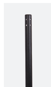
*alleen 5 mm canule

Canule gemaakt van niet-geleidend polycarbonaat* te gebruiken bij elektrochirurgische ingrepen