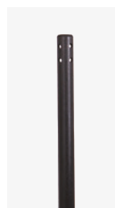
*alleen 5 mm canule

Canule gemaakt van niet-geleidend polycarbonaat ; * te gebruiken bij elektrochirurgische ingrepen