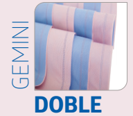
Lámina de esterilización doble Gemini

La lámina doble Gemini puede darle una mayor confianza en su proceso de esterilización. Dos láminas fusionadas entre sí proporcionan una fuerza excepcional y ayudan a mejorar la eficiencia. El color doble facilita la detección de agujeros y ayuda a diferenciar entre los sets de instrumentos.