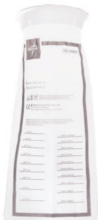
Sacchetto raccolta vomito - trasparente EMB02