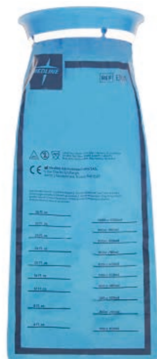
Bolsa azul de Émesis EMB01