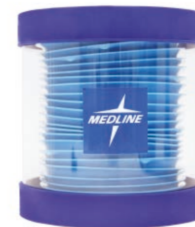
Dispensador de pared DISP01