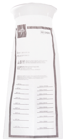
Sac vomitoire transparent EMB02