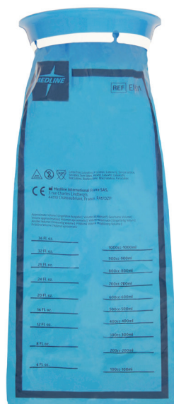
Sac hygiénique vomitoire bleu EMB01