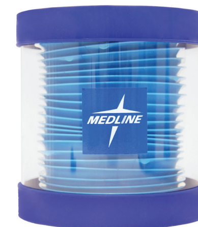
Distributeur mural DISP01