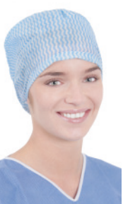
OP-Haube FS60950B 100 Stück/Box, 600 Stück/Karton OP-Haube, elastisch im Nackenbereich, flache Stirn, blau