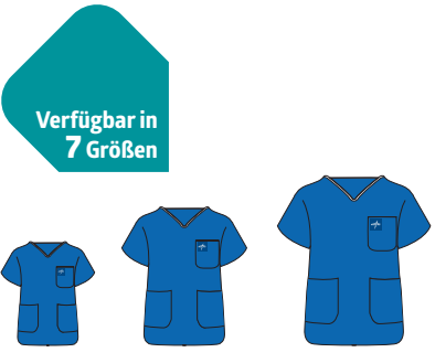
Verfügbar in 7 Größen