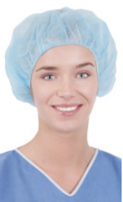
Fächerhaube FS65450 100 Stück/Box, 1.200 Stück/Karton Fächerhaube, Einheitsgröße, blau