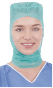
OP-Haube FS63100A 100 Stück/Box, 600 Stück/Karton OP-Haube, grün