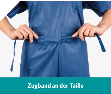
Zugband an der Taille