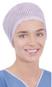
OP-Haube FS60950P 100 Stück/Box, 600 Stück/Karton OP-Haube, elastisch im Nackenbereich, flache Stirn, lila