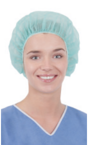
Bouffant-Haube FS63300 100 Stück/Box, 600 Stück/Karton Bouffant-Haube, Größe 53 cm, grün