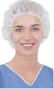
Bouffant-Haube CRIE1003 100 Stück/Box, 500 Stück/Karton Bouffant-Haube, Größe 60 cm, weiß