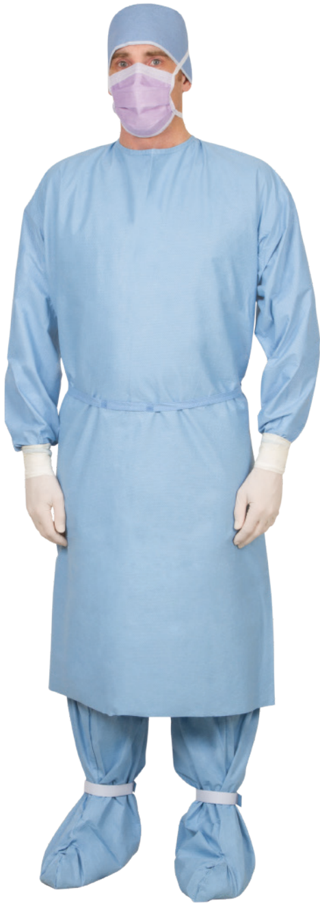
NONE27457: Kittel NONE27348PXL: Stiefelüberzüge

Kompletter Schutz in Kombination mit Polypropylen-Polyethylen-Trilaminat-Stiefelüberzügen (NONE27348PXL).