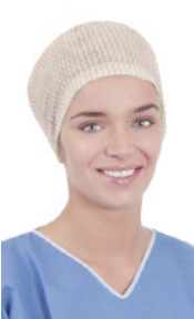
OP-Haube FS60950Y 100 Stück/Box, 600 Stück/Karton OP-Haube, elastisch im Nackenbereich, flache Stirn, gelb