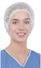
Fächerhaube FS65460 100 Stück/Box, 1.200 Stück/Karton Fächerhaube, Einheitsgröße, weiß