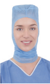
OP-Haube FS63150A 100 Stück/Box, 600 Stück/Karton Leichte OP-Haube, blau