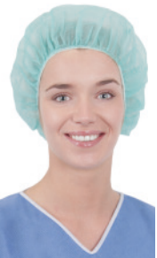
Bouffant-Haube CRIE1000 100 Stück/Box, 500 Stück/Karton Bouffant-Haube, Größe 53 cm, grün

Basic Line-Hauben wurden entwickelt, um besonders wirtschaftliche Anforderungen zu erfüllen. Die Basic Line -Produkte werden aus Spunbond-Polypropylen mit einem Gewicht von 12 g/m² bis 30 g/m² hergestellt. Die Basic Line Hauben werden in den Farben Blau, Grün, Weiß und mit aufgedrucktem Muster angeboten.