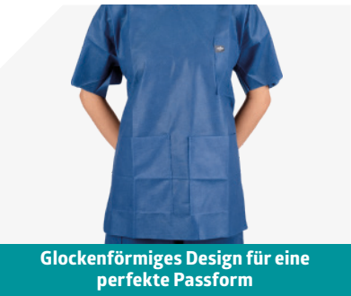
Glockenförmiges Design für eine perfekte Passform

Wir haben mit Anwendern wie Ihnen zusammengearbeitet, um Bereichskleidung nach Ihren Bedürfnissen zu entwickeln. Täglich neue, hygienische Bekleidung.