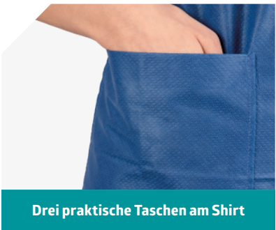
Drei praktische Taschen am Shirt