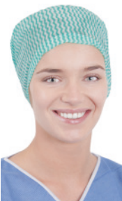
OP-Haube FS60950G 100 Stück/Box, 600 Stück/Karton OP-Haube, elastisch im Nackenbereich, flache Stirn, grün