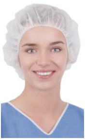
Bouffant-Haube CRIE1002 100 Stück/Box, 500 Stück/Karton Bouffant-Haube, Größe 53 cm, weiß

Basic Line-Hauben wurden entwickelt, um besonders wirtschaftliche Anforderungen zu erfüllen. Die Basic Line -Produkte werden aus Spunbond-Polypropylen mit einem Gewicht von 12 g/m² bis 30 g/m² hergestellt. Die Basic Line Hauben werden in den Farben Blau, Grün, Weiß und mit aufgedrucktem Muster angeboten.