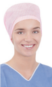
OP-Haube FS60950PK 100 Stück/Box, 600 Stück/Karton OP-Haube, elastisch im Nackenbereich, flache Stirn, rosa