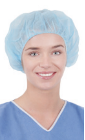
Bouffant-Haube FS63350 100 Stück/Box, 600 Stück/Karton Bouffant-Haube, Größe 53 cm, blau