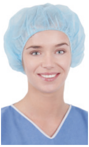
Bouffant-Haube CRIE1004 100 Stück/Box, 500 Stück/Karton Bouffant-Haube, Größe 60 cm, blau