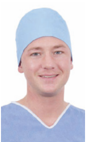
OP-Haube FS63450A 100 Stück/Box, 600 Stück/Karton OP-Haube, Schiffchenform, blau