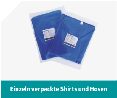
Einzeln verpackte Shirts und Hosen