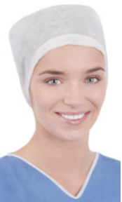
OP-Haube FS60950W 100 Stück/Box, 600 Stück/Karton OP-Haube, elastisch im Nackenbereich, flache Stirn, weiß