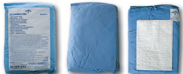
NONE27280 - NONE27280XL