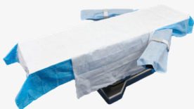
DYKQSUITEL3CEA 1 champ de table d'opération (long) 1 drap de transfert 2 protections d'appui-bras