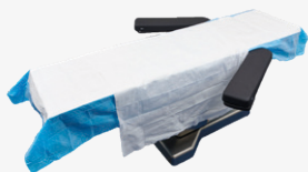
DYKQSUITEL2CEA 1 champ de table d'opération (long) 1 drap de transfert