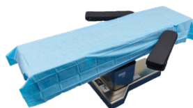
DYND4090NA Protection de table d'opération