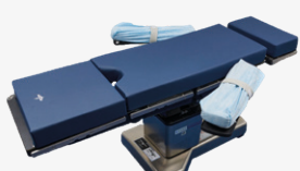
Protections d'appui-bras QSACOVER (à enfiler) QSACEL01 (ajustées avec sangles)