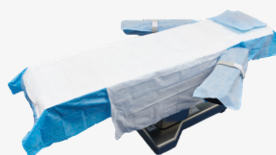
DYKQSUITEL4CEA 1 champ de table d'opération (long) 1 drap de transfert 2 protections d'appui-bras 1 housse pour oreiller