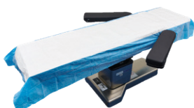
DYND4090SBE Champ de table d'opération (long) ; super-absorbant