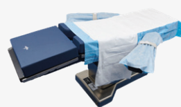
DYKQS01 1 champ de table d'opération (court) 1 drap de transfert 2 protections d'appui-bras