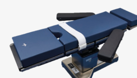
Sangle patient ORS01

Pour plus d'informations sur ces produits, merci de contacter votre responsable commercial Medline local ou consulter notre site Internet sur : www.medline.eu/fr