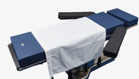
Drap de transfert DYND4090FTD (long) DYND4090FTD (court) QSL01 (à poignées)