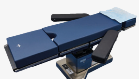
Champ de tête DYKQSHPC1CEA (38 x 39 cm) QSHPC (45 x 55 cm)