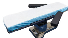
DYND4090FTD Drap housse de protection super-absorbant