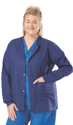
Herbruikbare Warm-Up Jacket assortiment

Medline's herbruikbare en disposable Warm-Up Jackets assortiment is ontworpen met materialen die zorgen voor een hoog niveau van comfort terwijl uw personeel warm blijft. Daarnaast hebben ze een intuïtief ontwerp met een zachte tricot kraag, manchetten of elastiek bij de mouwen en handige zakken.