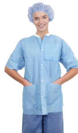
Gamme de blousons de bloc Essential à manches courtes