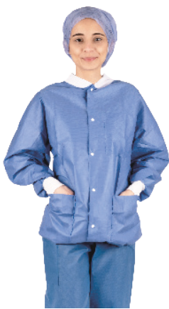
Soft-Thermojacken mit langen Ärmeln