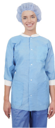
Essential-Thermojacke mit Dreiviertel-Ärmeln