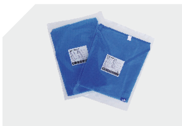
Einzel verpackte Shirts und Hosen