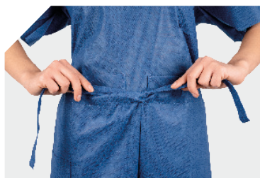
Zugband an der Taille