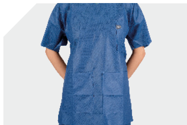
Glockenförmiges Design (A-Linie) für eine perfekte Passform

Wir haben mit Anwendern wie Ihnen zusammengearbeitet, um Bereichskleidung nach Ihren Bedürfnissen zu entwickeln. Täglich neue und saubere Bekleidung.