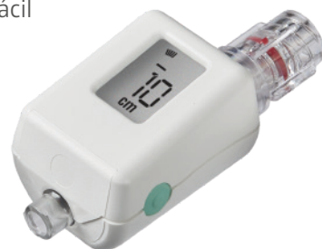
Compass Thoracentesis CTHR002-INT

Para mais informações sobre este produto, entre em contacto com seu gestor de conta Medline ou consulte o nosso website em pt.medline.eu