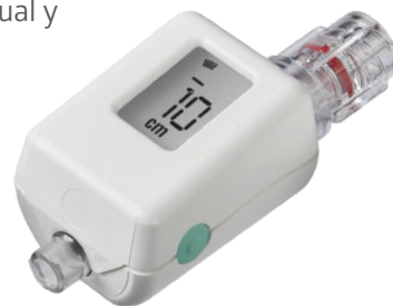
Compass Toracocentesis CTHR001-INT

Para obtener más información sobre este producto, póngase en contacto con su delegado comercial de Medline o visite nuestra página web: www.medline.eu/es